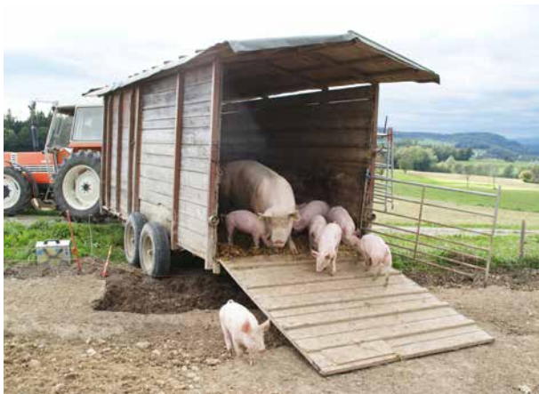
Einfache Einrichtungen kennzeichnen die Freilandhaltung.

Das Areal ist von zwei Zäunen umgeben, aussen von einem flexiblen Maschenzaun, wie er für Schafe verwendet wird, und innen von drei Drähten. Beide Zäune stehen unter Strom. Der äussere Zaun soll vor allem Wildschweine abhalten. Auf deutschem Gebiet, auf welchem Siegrists auch einige Felder haben, ist dieser Zaun Vorschrift und zwar vor allem wegen der Gefahr, dass Wildschweine die Schweinepest übertragen könnten. Um das Futter müssen sich die Ferkel noch nicht gross sorgen, denn das bekommen sie vor allem über die Muttermilch. Je älter sie werden, desto mehr fressen sie in den langen Trögen, aus denen ihre Mütter gefüttert werden. Ein eigenes Ferkelfutter bekommen sie nicht.