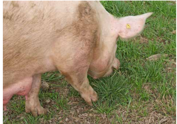
Die Freilandhaltung erlaubt ein weitgehend natürliches Verhalten der Tiere.