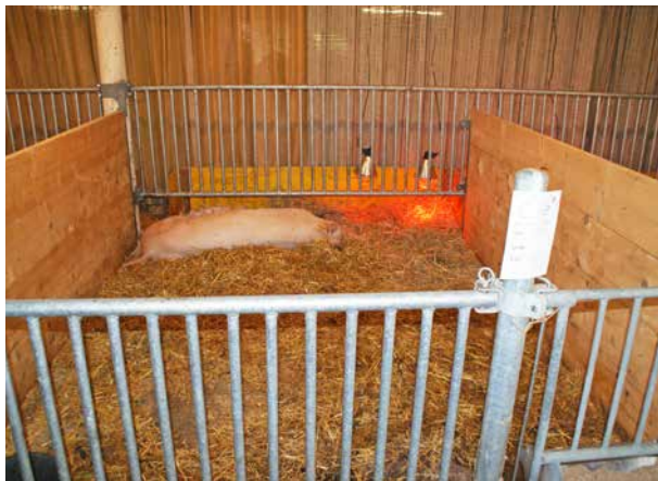
Geburt im Stall.