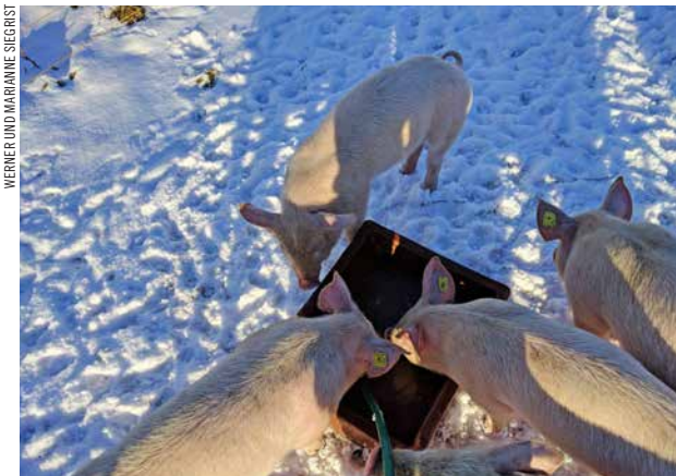
Auch im Winter fühlen sich die Schweine im Freiland wohl ...