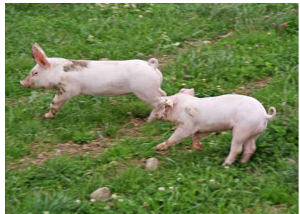
Kaum sind Mutter und Ferkel im Freiland, nutzen sie die Freiheit.