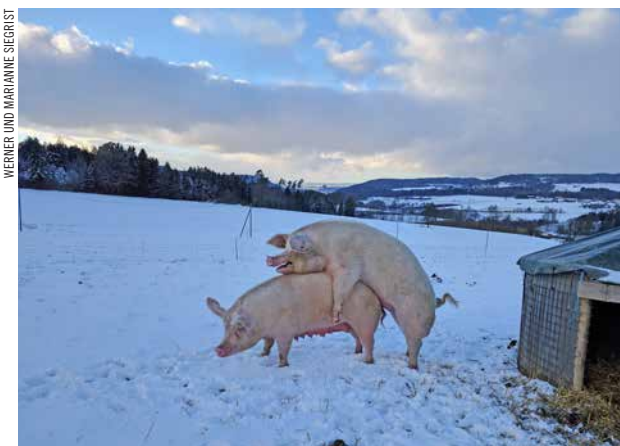
... wenn sie sich zum Liegen an einen warmen Platz zurückziehen können.