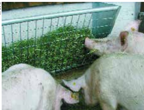
An einer Raufe mit frischem Stroh oder Heu beschäftigen sich Schweine gerne.