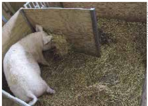
AGROSCOPE F&amp;T TANIKON

In natürlicher Haltung sondern sich hochtragende Sauen einige Tage vor der Geburt von der Gruppe ab und bauen mit Ästen, Heu und Gras ein Geburtsnest. Dort bringen sie ihre Jungen zur Welt und kehren nach einigen Tagen mit ihnen zur Gruppe zurück. In der landwirtschaftlichen Tierhaltung kommt die hochtragende Sau in eine separate Abferkelbucht. Auch dort zeigt die Sau ihr angeborenes Nestbauverhalten. Einige Stunden vor der Geburt wird sie unruhig und fängt an, mit ihrem Maul Stroh zusammenzutragen. Um dieses Nestbauverhalten durchführen zu können, benötigt sie viel langes Stroh. Ein Nest ist wichtig, da sonst die Ferkel frieren. In der Abferkelbucht ersetzt ein beheiztes Ferkelnest das natürliche Nest. Wenn die Neugeborenen das Nest nicht finden, sollte der Tierhalter sie ins Nest bringen. Während der Geburt ihrer meist 10-14 Ferkel liegt die Sau. Die Neugeborenen krabbeln zum Gesäuge der Mutter, wobei die Nabelschnur reisst. Oft saugen sie schon Minuten nach der Geburt am Gesäuge ihrer Mutter. In den ersten Tagen bildet sich eine Saugordnung aus, das heisst, jedes Ferkel besitzt seine eigene Zitze, welche es gegenüber anderen verteidigt.