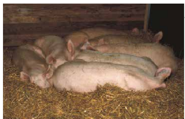
AGROSCOPE F&amp;T TÄNKÖN

In der Natur suchen sich Schweine vor Einbruch der Dämmerung einen geschützten Ort, tragen Nestmaterial, z.B. Grasbüschel zusammen und schlafen dann gemeinsam in der Gruppe. Sie liegen gerne weich, trocken und warm, wozu man ihnen im Stall am besten Stroh einstreut. Ist es kalt, liegen sie eng zusammen und wärmen einander. Im Sommer liegen sie dagegen weiter auseinander und benötigen mehr Platz.